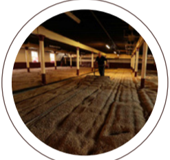
Die Gerste wird durchschnittlich 6 Mal pro Tag (alle 4 Stunden) gewendet